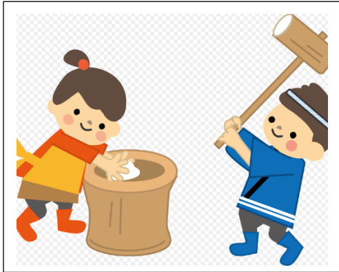
しき さと 四季の里